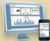
StecaGrid Portal Web-Portal