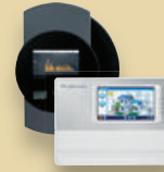
Solar-Log™ und Meteocontrol WEB'log Zubehör