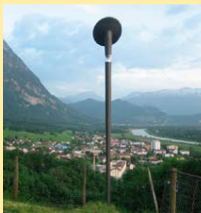
Abb.: Bern, Schweiz