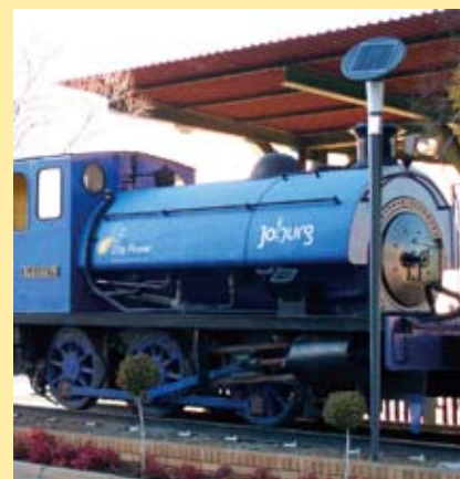
Abb.: Triesen, Liechtenstein