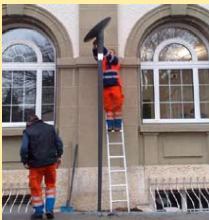
Abb.: Dubai, Vereinigte Arabische Emirate